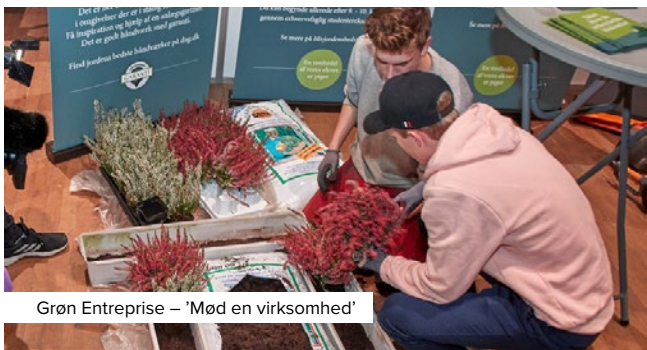
Grøn Entreprise – 'Mød en virksomhed'