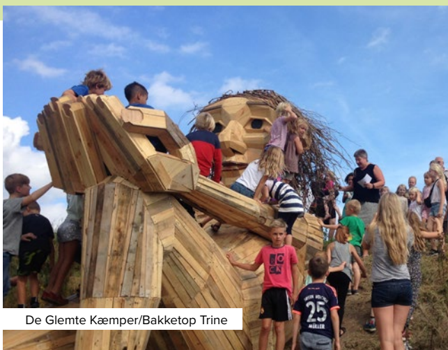
De Glemte Kæmper/Bakketop Trine

form af kulturturisme og en afledt værditilvækst i det lokale erhvervsliv. Thomas Dambos værk "De Glemte Kæmper" er et eksempel på, hvordan kunst og kultur kan tiltrække publikum og medier fra nær og fjern – besøgende, som handler og er med til at skabe liv, mens de opholder sig i lokalområdet.