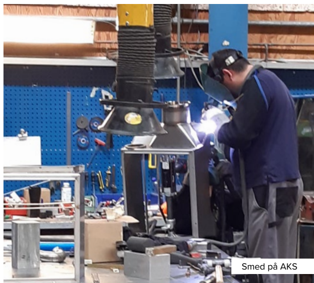
Smed på AKS

Tallene er baseret på antal registrerede CVR numre. Kilde: smvportalen.dk, Iværksætterundersøgelsen (2019) og bisnode.dk