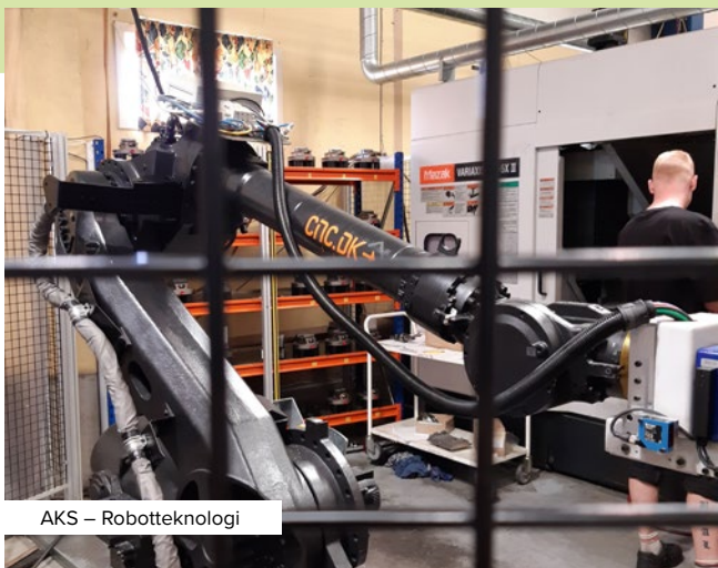
AKS – Robotteknologi