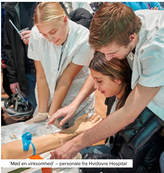
'Mød en virksomhed' – personale fra Hvidovre Hospital

I årene fremover vil der stadig være behov for, at kommunen og virksomhederne samarbejder om at finde nye løsninger i forhold til manglen på kvalificeret arbejdskraft. Uddannelse og ny teknologi er oplagte veje at gå, men der kan også være andre mere utraditionelle løsninger. Tæt dialog og stærke relationer er et godt fundament for udvikling af nye løsninger til fremtidens erhvervsliv.