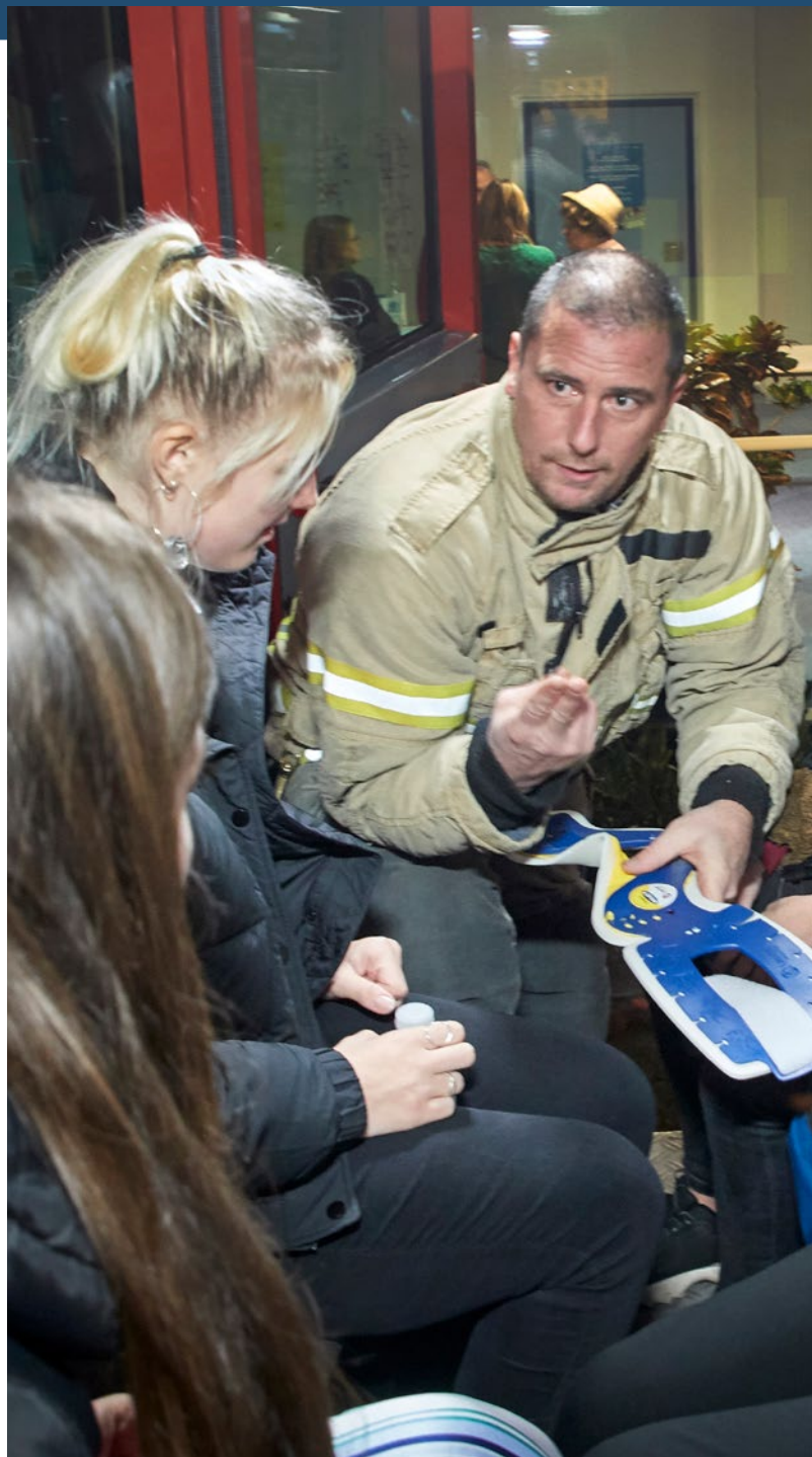
Hovedstadens Beredskab på 'Mød en virksomhed'